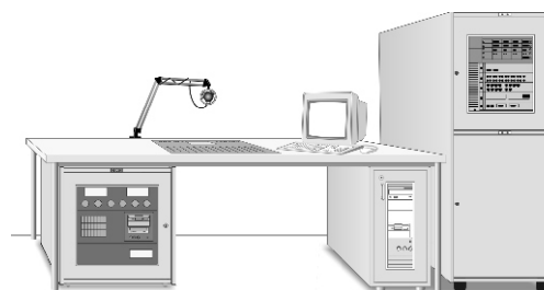
Beispiel schalldämmter Studio-Arbeitsplatz mit 19-Zoll-Systemen & Rechnern

Zusätzlicher Staubschutz verhindert Wärmestau durch Staubablagerungen im Inneren der Systeme.